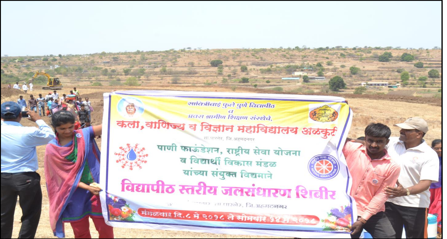
NSS Students Digging a dam for Water at Nadurpathar