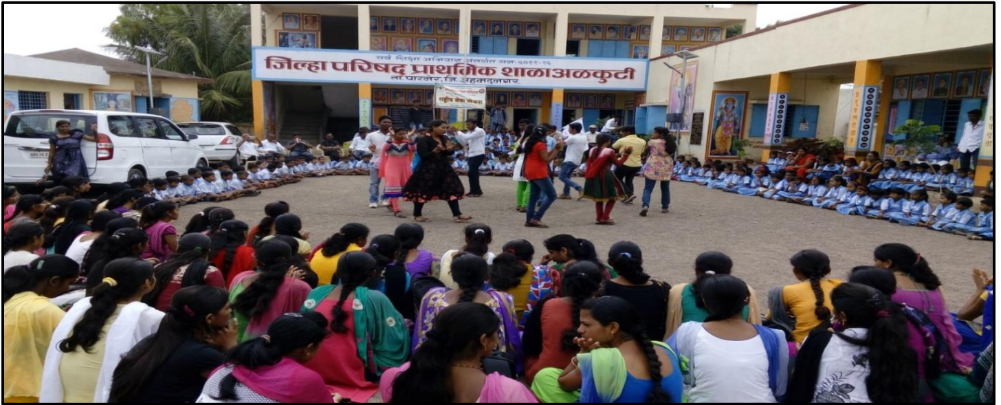
NSS Students Perform Swachh Bharat Abhiyan Pathnatya at Alkuti