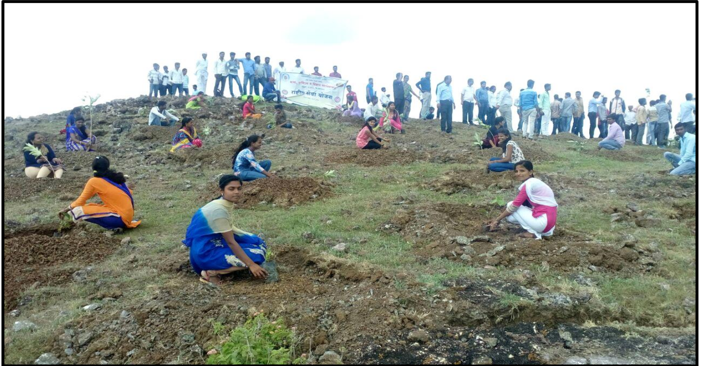
Tree Plantation at Mhaskewadi (Sahyadri Devrai)