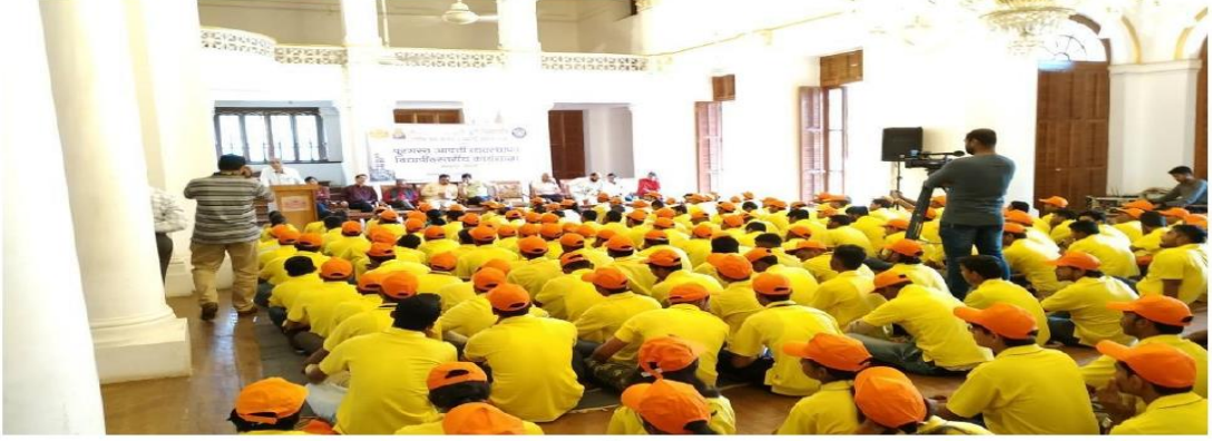
(शिबिरार्थींना मार्गदर्शन करताना मान्यवर)

निवड केलेल्या पुरग्रस्त गावातील एकूण परिस्थिती पाहता सावित्रीबाई फुले पुणे विद्यापीठ व संलग्नित पुणे, अहमदनगर, नाशिक या जिल्ह्यातील विविध महाविद्यालयांना पुरग्रस्त आपत्ती निवारण शिबिरामध्ये स्वयंसेवकांना सहभागी होण्याचे विविध माध्यमातून आवाहन केले. पुढील दोन दिवसांमध्ये विविध महाविद्यालयातून ५०० हुन अधिक स्वयंसेवक व १५ कार्यक्रम अधिकारी विद्यापीठा मध्ये दाखल झाले. दिनांक २२ ऑगस्ट च्या सकाळी ९.०० वाजता सावित्रीबाई फुले पुणे विद्यापीठाच्या मुख्य इमारती जवळील ज्ञानेश्वर सभागृहामध्ये सर्वांना एकत्रित बोलावण्यात आले. पुरग्रस्तांसाठी एक हात मदतीचा या भावनेने ५०० हुन अधिक स्वयंसेवक लोकडो किलोमीटरचा प्रवास करुन उपस्थित राहिले.