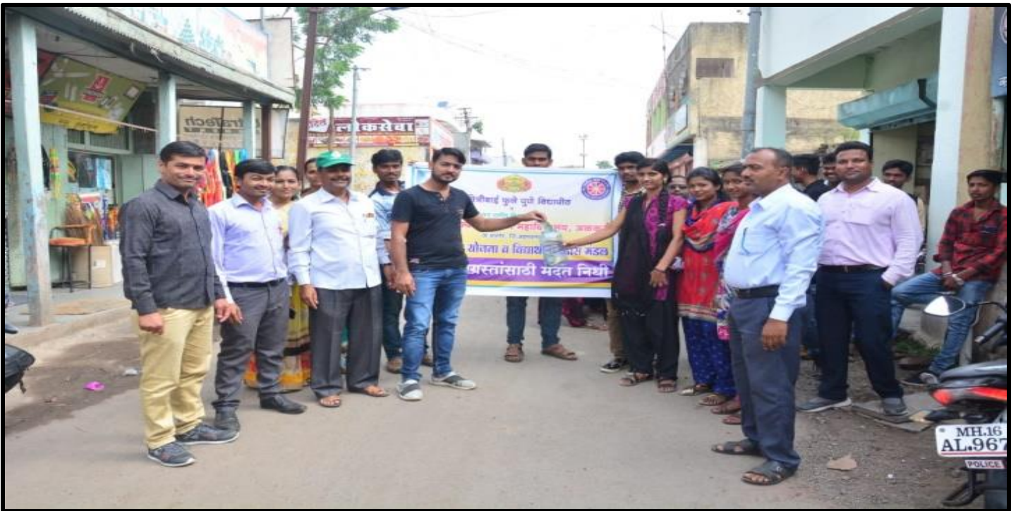
NSS Students collect Kerala flood fund at Alkuti Village