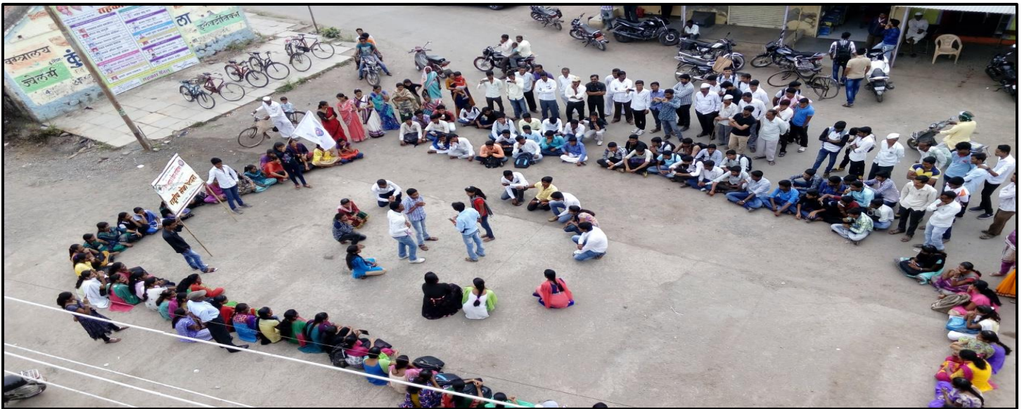
NSS Students Perform Swachh Bharat Abhiyan Pathnatya at Alkuti Stop