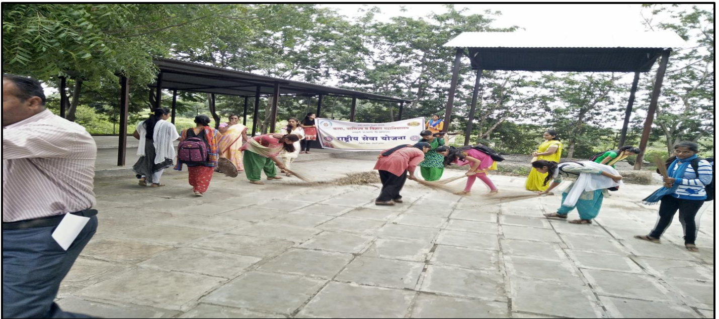
NSS Volunteers cleaning various places in the Jambut village