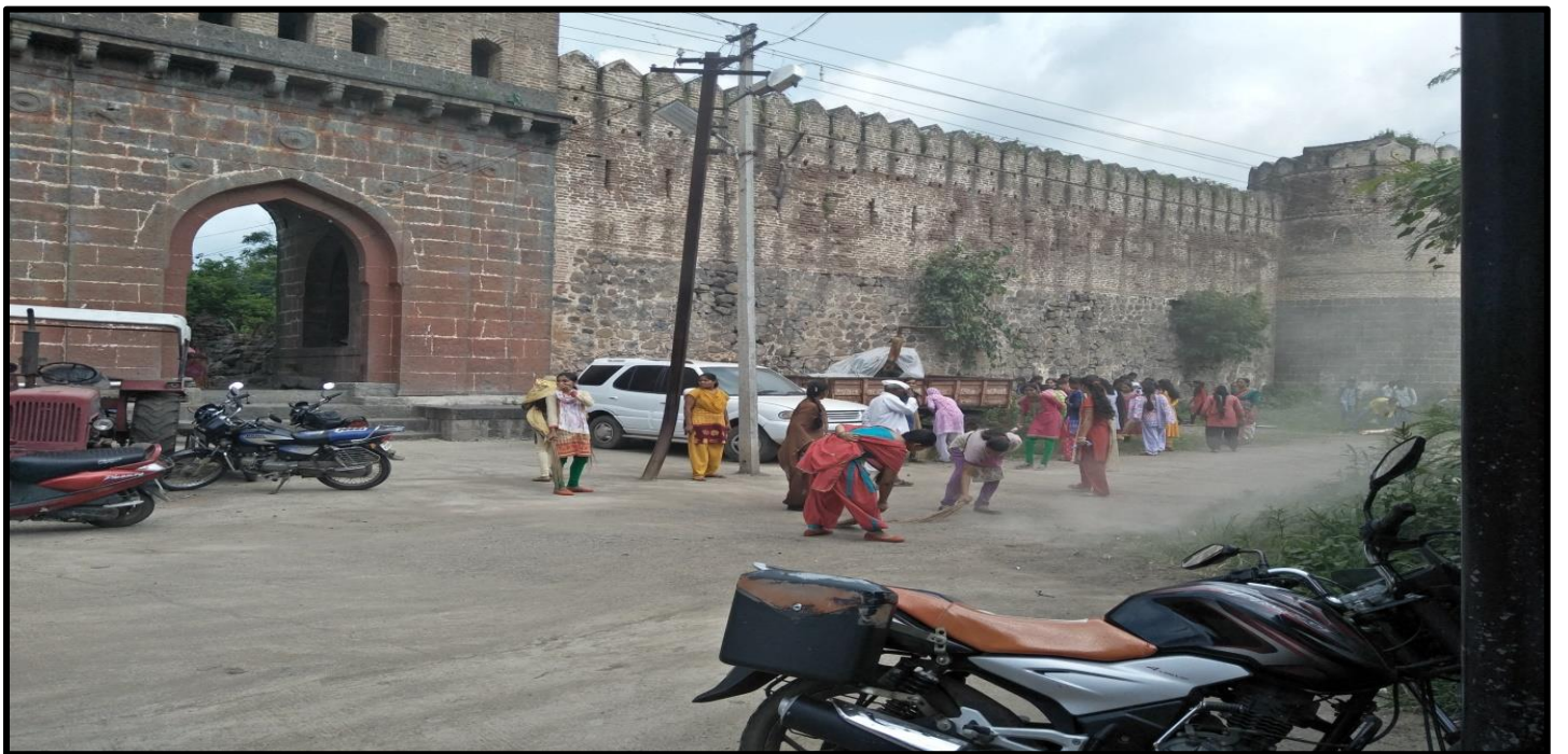
NSS Students Clean Historical Place at Alkuti