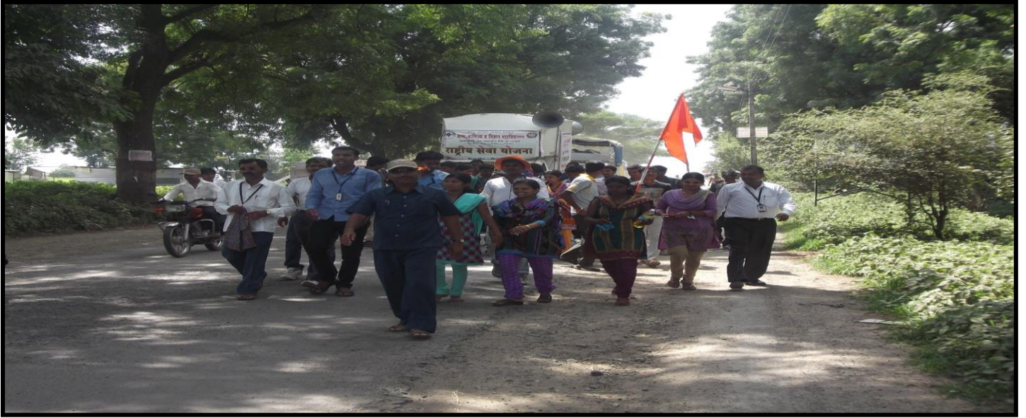
Lek Vachava Abhiyan Rally