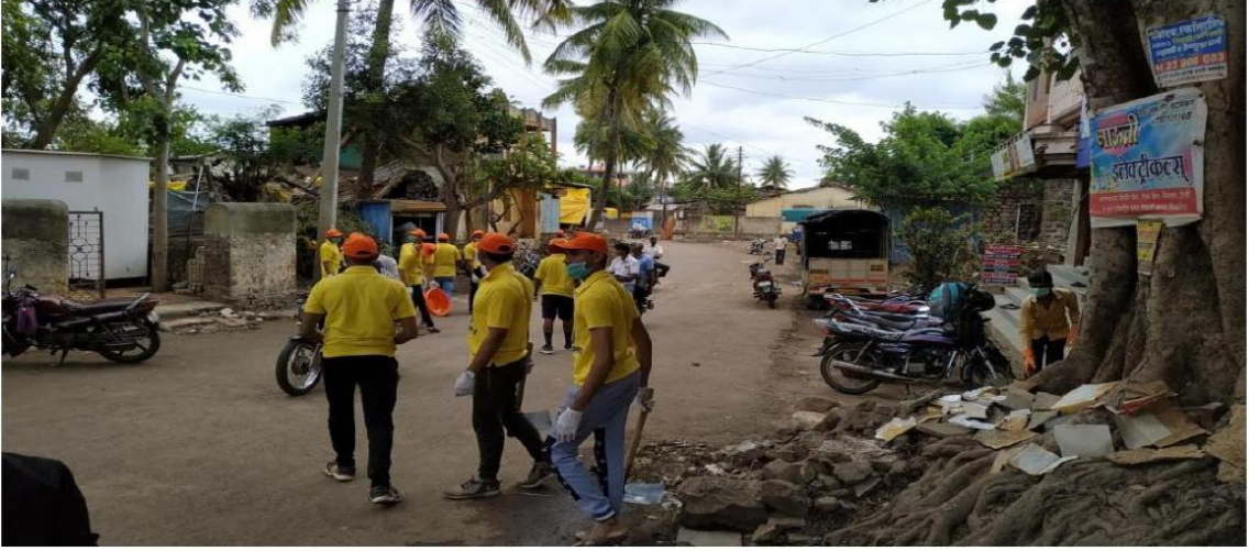
(स्वच्छता अभियानामध्ये सहभागी स्वयंसेवक)