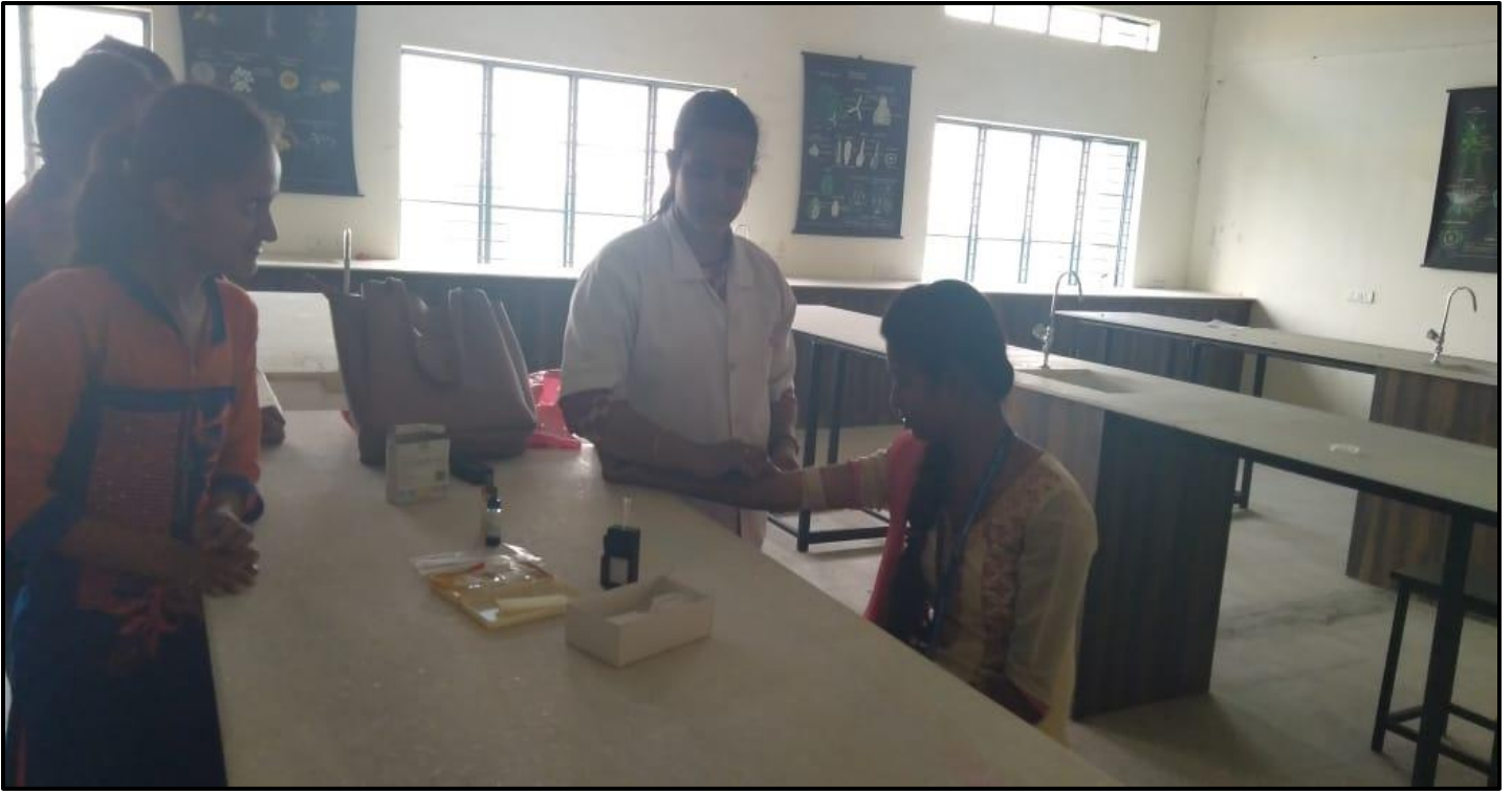
While Checking the hemoglobin of the students in the camp