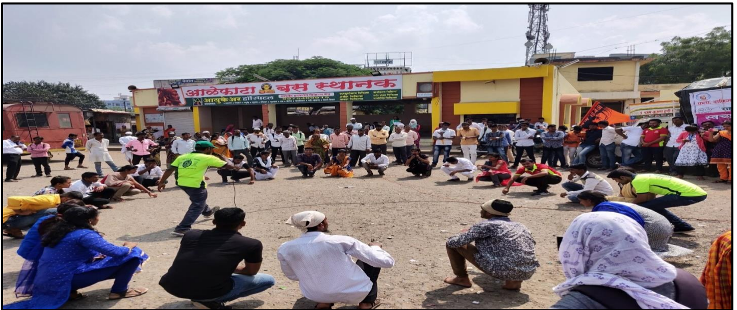
NSS Students Perform Swachh Bharat Abhiyan Pathnatya at Alephata Bus stop