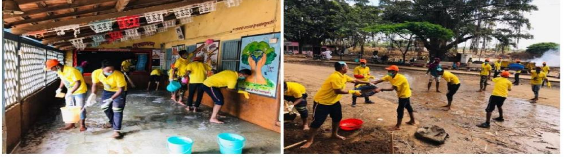
(जिल्हा परिषद मराठी विद्यामंदीर शाळा, खिद्रापूर चिखलयुक्त शाळा व शाळेचा परिसर स्वच्छ करताना)

शिविराच्या ४ थ्या दिवशी अकिवाट या गावातील स्वयंसेवकांचे दोन गट खिद्रापूर या गावी रवाना केले. दरम्यान खिद्रापूर येथिल प्राथमिक शाळेचे वर्ग १० दिवसांपासून बंद असल्याचे कळाले. तेथिल दोन्ही शाळा पूर्णपणे पुराच्या पाण्यात होत्या. त्यामुळे वर्गांमध्ये चिखल साचल्या कारणाने दिनांक २६/०८/२०१९ पर्यंत शाळांना सुट्टी जाहिर करण्यात आली होती. २४ तारखेच्या पाहणीनंतर आम्ही सर्वांनी तिथल्या ग्रामस्थांना शाळा स्वच्छ करून देण्याचे आश्वासन दिले. आज सकाळपासून आपले स्वयंसेवक हे काम युद्ध पातळीवर करत आहेत.