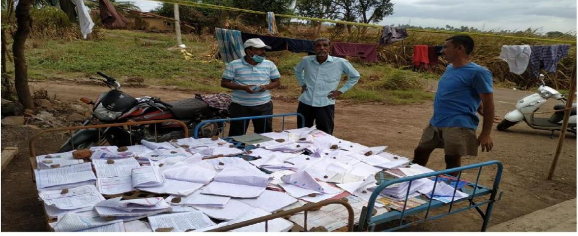
(पुरामध्ये भिजलेली घर व शेती खरेदी, शैक्षणिक व शासकीय महत्वाची कागदपत्रे सुखविताना पुरग्रस्त नागरिक)