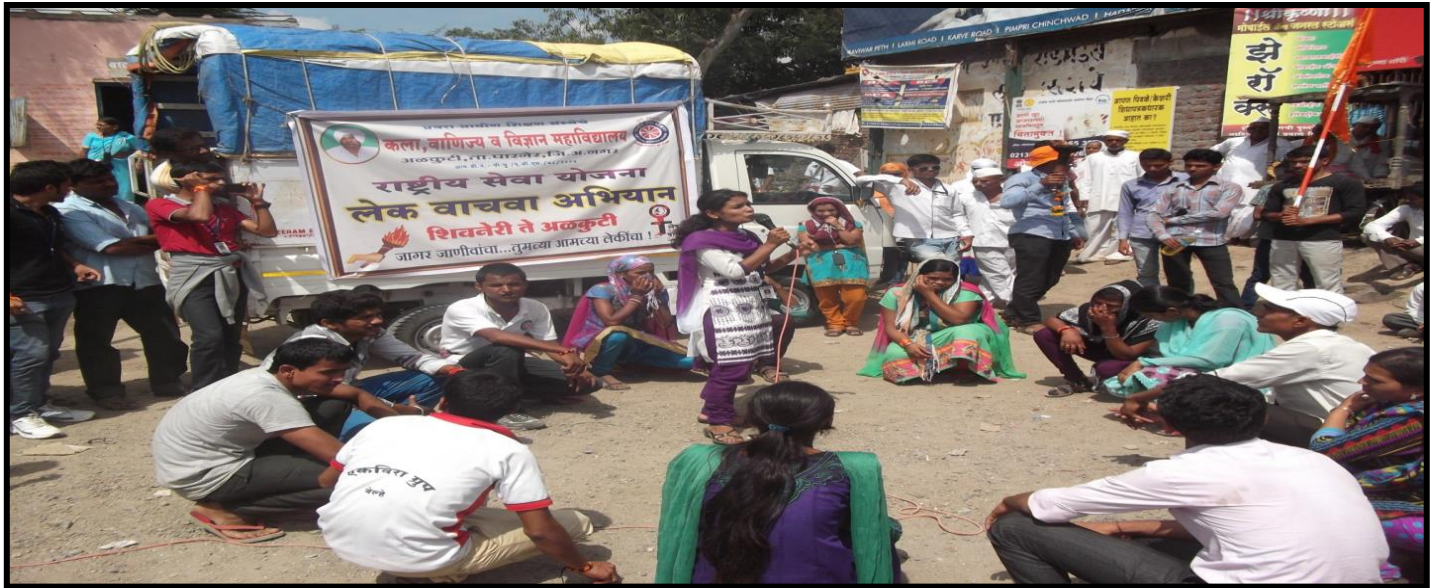
NSS Students perform Lek vachava Abhiyan Pathnatya