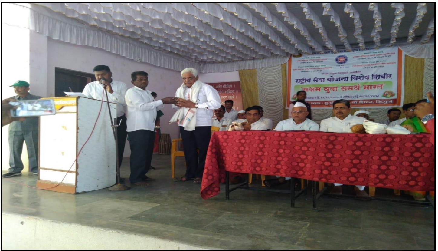
Inauguration Function of NSS Camp at Jambut